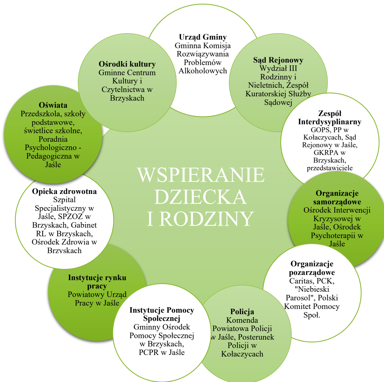
Wykres 3 - Podmioty działające na rzecz dziecka i rodziny.